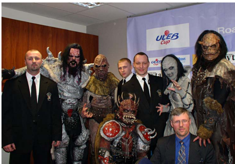
2007 m. Lietuvoje koncertavusi „Eurovizijos“ nugalėtoja sunkiojo roko grupė „Lordi“ su „Ekskomisarų biuro“ darbuotojais.

Nors daugiau pikantiškų detalių ir užkulisų specialistas neatskleidžia, tačiau pripažįsta, kad rūpinimasis asmens apsauga yra sudėtingas, kruopštus