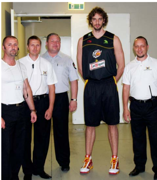
Į Lietuvą atvykusi krepšinio žvaigždė Pau Gasolis (viduryje) nusifotografavo su jo ir kitų žaidėjų saugumu besirūpinusiais „Ekskomisarų biuro“ specialistais.