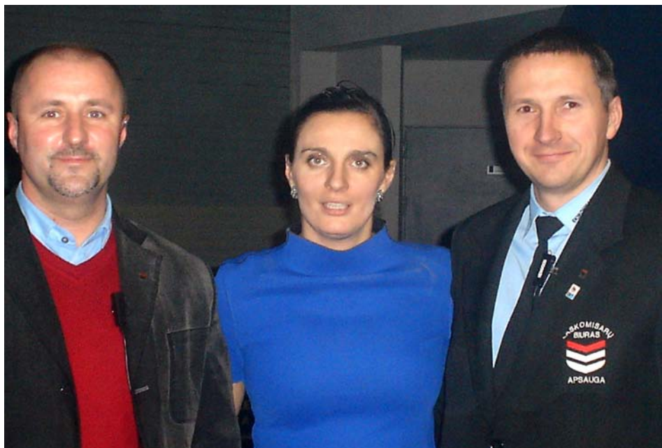
Sausį Vilniuje koncertavusi šiuolaikinio Rusijos šansono karalienė Eelena Vaenga (viduryje).