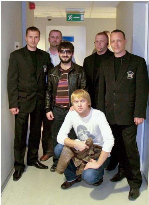
Linksmasis „Nasha Russia“ kolektyvas su juos saugojusiais darbuotojais.

pasirengimo reikalaujantis darbas, kuriame būtina numatyti kelis žingsnius į priekį ir mokėti reaguoti skirtingose situacijose. Todėl darbuotojai rengiami specialiuose mokymuose, nuolat gilina žinias, kad teisingi veiksmai taptų refleksu.